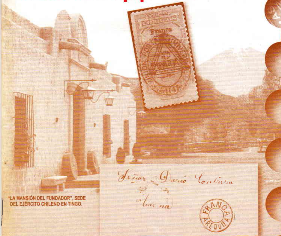
"LA MANSIÓN DEL FUNDADOR", SEDE DEL EJÉRCITO CHILENO EN TINGO.