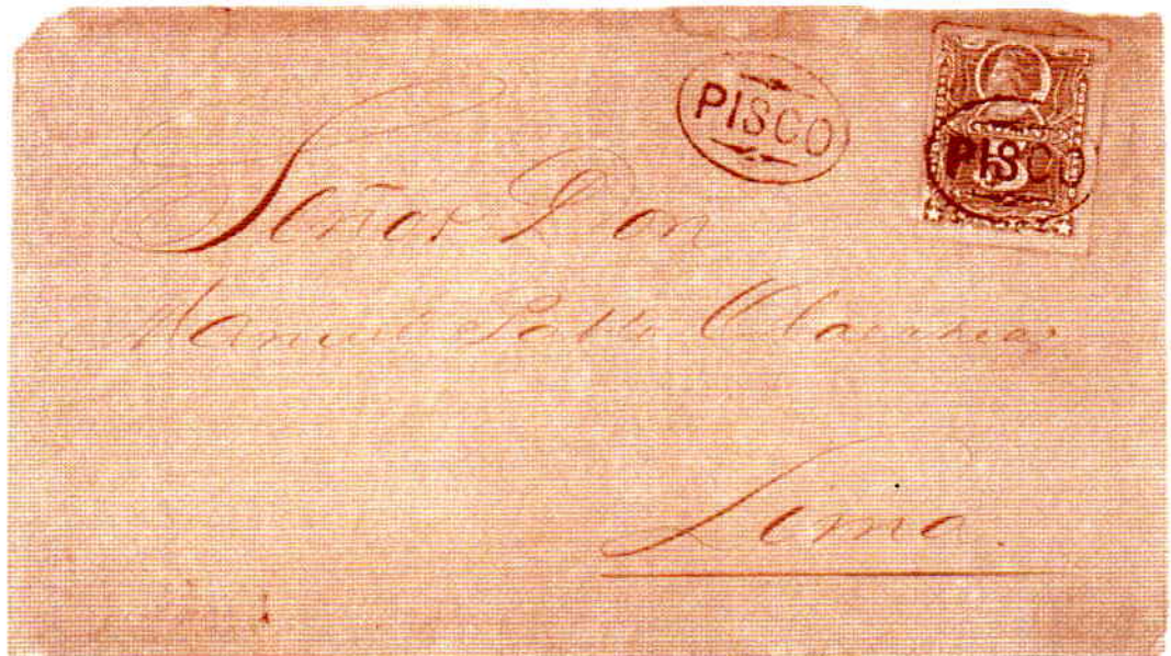
Sobre de Pisco a Lima, con sello de recepción de 28 de setiembre de 1883. El correo del puerto de Pisco fue ocupado por la Administración chilena el 26 de mayo de 1881. Tarifa de 5 centavos para carta simple.